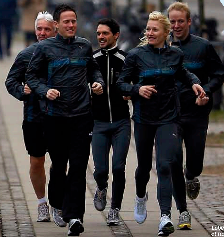
Løbetræning med kollegerne skaber et fælleskab på tværs af stillinger og afdelinger. Det giver sammenhold og et stærkere engagement på arbejdspladsen.

Firmaløb giver dig: > bedre kolleger > et sundere liv > energi til at nå mere