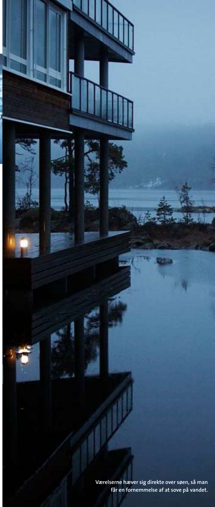
Værelserne hæver sig direkte over søen, så man får en fornemmelse af at sove på vandet.

■ Menukortet funkler: Delikat vegetarisk spamad.