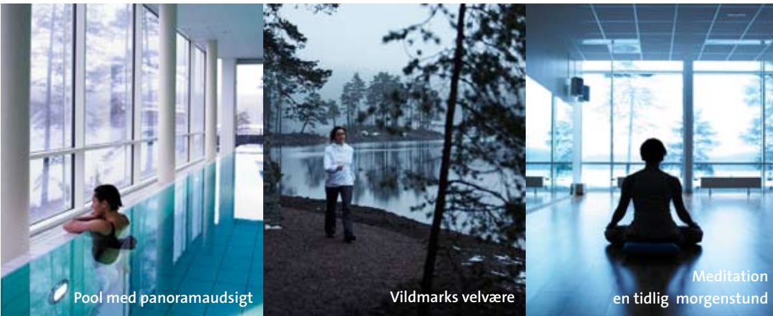
Pool med panoramaudsigt