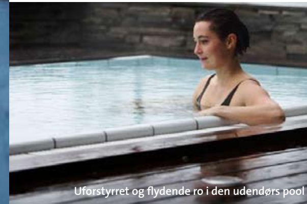
Uforstyrret og flydende ro i den udendørs pool

på en kold dag, hvor kulden rammer ansigtet, mens kroppen ligger varmt og roligt under vandet. Også saltvandsbassinet indenfor påvirker sanserne. Det er bygget, så man ikke kan se kanten, mens man svømmer, derfor føles det som om, at man svømmer i søen uden for. Det får tid og rum til at ophøre for en stund, måske er det et glimt af zen – om ikke andet er jeg nu helt afslappet. □